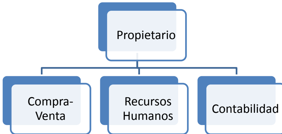
FIGURA 6. Organigrama de la empresa