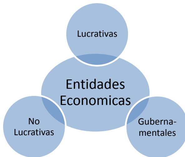
Figura 5 Entidades Económicas. Elaboración propia

Las entidades se pueden clasificar con base en su objetivo principal y dentro de la actividad económica que desarrolla en la sociedad. (Ver figura 1.)